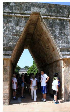
墨西哥瑪雅古跡門