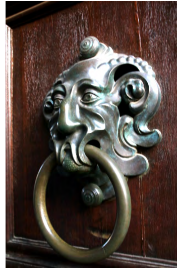
英國博物館門把手