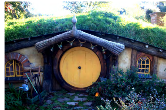
新西蘭霍比特村民居門