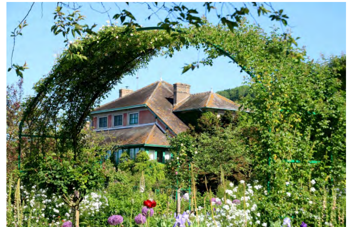
法國畫家莫納花園門