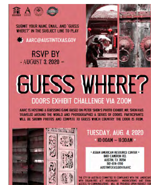
有獎猜門謎語活動