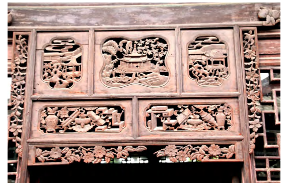
中國山西皇城相府門