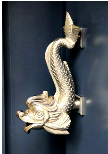
西班牙銀行門把手