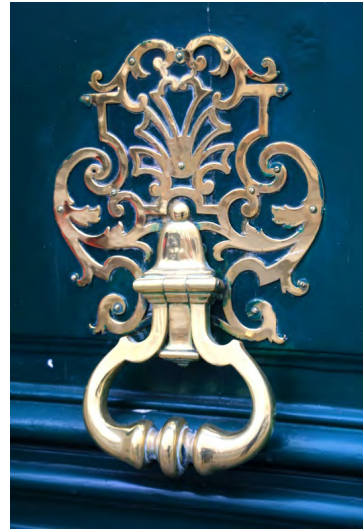
阿根廷公寓門把手