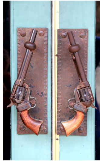
美國死木鎮槍店門把手