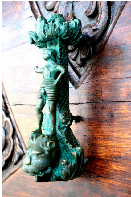
杜布羅夫尼克宮廷門把手