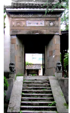
中國仰山書院大門