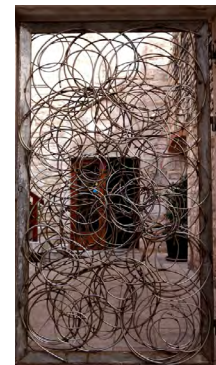
斯洛文尼亞飯店門