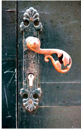
波斯尼亞居民門把手