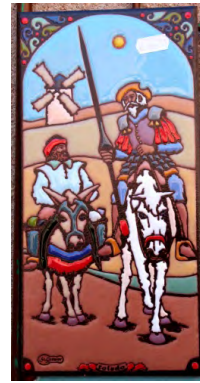
西班牙堂吉訶德家門