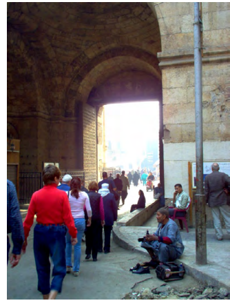
直布羅陀首領家門